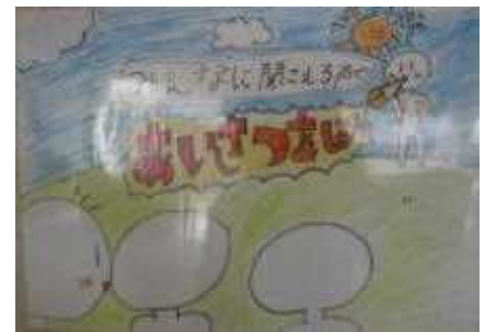
【手作りのポスター】

子どもたちががんばっていることはもちろんですが、それぞれのご家庭で、あいさつの大切さについて話をさせていただいたり、ボランティアの皆様、保護者の皆様が、登下校の見守りや旗当番の時の声かけをしていただいたりするなど、 家庭、地域が一体となつての取組のおかげでもありません。 あいさつは、 子どもたちが社会に出るまでに、身に付けておかなければならない大切な習慣の一つ でもあります。これからもあいさつができるよう、子どもたちとともに取り組んでいきますので、保護者の皆様、地域の皆様、ご協力をよろしく申し上げます。