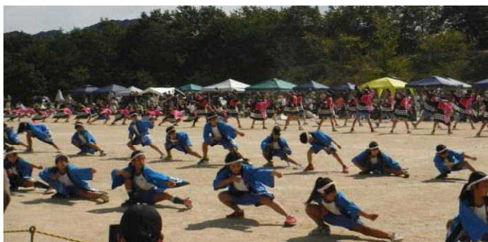
【今年も迫力満点 桜小伝統の「ソーラン節」】

新型コロナウイルス感染症に係る「まん延防止等重点措置期間」に伴い、予定した日を延期しての実施となりました。また、10月の土日は、中旬まで幼稚園、保育園等の駐車場や雨天時の会場として、本校の施設が