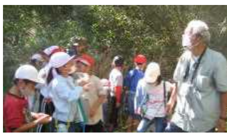
【2年生 自然保護センター】

なお、5年生は、11月2日(火)にJFEスチールとさん太新聞館を訪問する予定です。